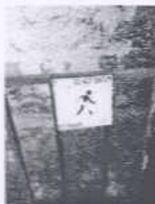
Identificación de rótulo y barrera física en malas condiciones