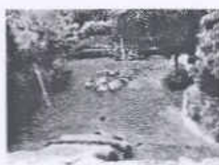
Supervisión de ceremonias en la Plaza Este (Templo de las Manos Rojas)

Atentamente me despido de usted, deseándole éxitos en todos sus proyectos.