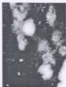
Identificación de dibujo en el suelo