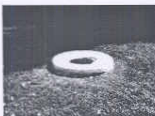
Altar de Plaza Este arreglado.