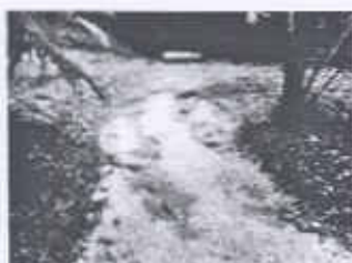
Verificación de relleno de sendero