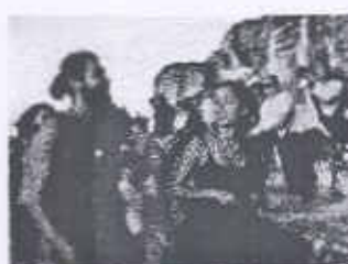
Apoyo para mantener capacidad de carga en Templo de las manos rojas